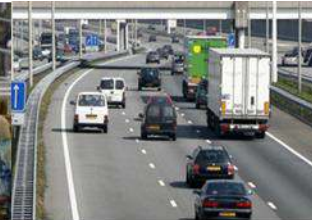
Verkeer en Vervoer