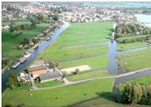
Ruimte en Wonen

25 mei 2020 versie 0.1 auteur C.Verhagen