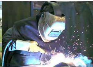
Economie, Onderwijs en Arbeidsmarkt